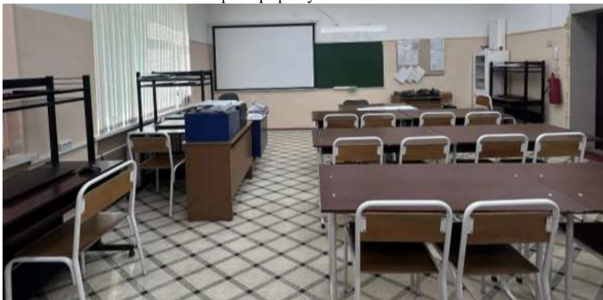
фотографии учебного кабинета